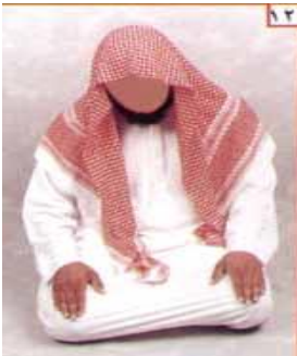
ስዕል ቁጥር 12

-- በመቀጠል ልክ የመጀመሪያ ሱጁድ እንዳደረጉት ሁለተኛውን ሱጁድ ማድረግ