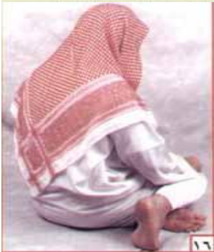
ስዕል ቁጥር 16

ትርጉም:- ክብር ሰላቶችና መልካም ነገሮች ለአላህ ነው ፣ አንቱ ነብይ ሆይ የአላህ እዝነቱና በረከቱ ለርስዎ ይሁን ፣ ሰላም ለእኛና ለመልካሞቼ የአላህ ባሮች ይሁን ፣ ከአላህ በስተቀር በሃቅ የሚገዙት ሌላ አምላክ እንደሌለና መሐመድም የአላህ መልዕክተኛ መሆናቸውን እመስክራለሁ።ማለት