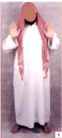
ስዕል ቁጥር 1

-- ዲዳ (መናገር የሚሳነው ሰው) ከሆነ ተክቢራን በልቡ በኒያ ማለት አለበት።