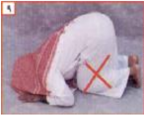
ስዕል ቁጥር 9