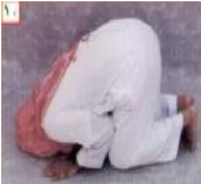
ስዕል ቁጥር 10