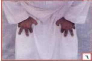
ስዕል ቁጥር 5 ና 6

ጣቶችን ዘርዘር አድርጎ ሁለት ጉልበትን ይዞ በጣም ሳያዘቀዝቁ በጥቂቱም ሳያጎብጡ በመካከለኛ ወገብን ለጥ አድርጎ ጎንበስ ማለት ነው። (መይበልጥ ለመረዳት ቁጥር 5 ና 6 ስዕልን ይመልከቱ) በሩኩዕ ወቅት ሱብሐነ ረቢያል ዓዚም) አንድ ጊዜ ማለት ግዴታ ሲሆን ከአንድ በላይ ሱና ነው።