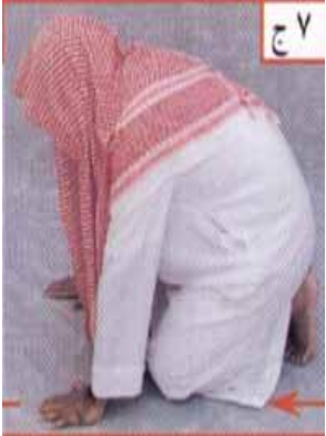
ስዕል ቁጥር 7 ጂም

-- ከሩኩዕ ከተነሱ በኋላ ረባና ለከል ሐምድ ሲባልም ሆነ ሌሎች ዱዓዎች ሲደረግ (በቁጥር 3 እና 4 ስዕል) ላይ እንደሚታየው በቀኝ እጅ የግራ እጅን መዳፍ ጀርባ ይዞ ደረት ላይ ማሳረፍ ሱና ነው።