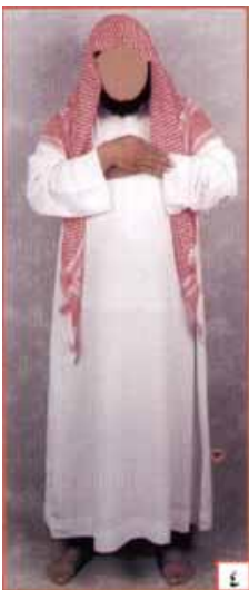
ስዕል ቁጥር 3

ወይንም በቁጥር 4 ስዕል ላይ እንደሚታየው ቀኝ እጃቸውን በግራ እጃቸው መዳፍ ጀርባና ክንድ ላይ አሳርፈው ደረታቸውን ይይዛሉ ::