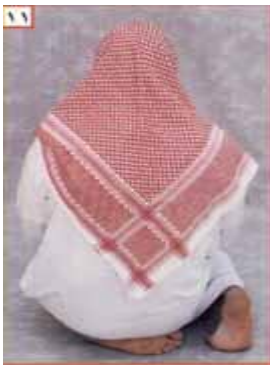
ስዕል ቁጥር 11