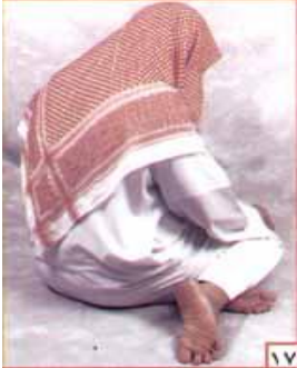
ስዕል ቁጥር 17

-- ሰላቱ ባለሦሥት ወይንም ባለአራት ረከዓት ማለትም ዙሁር ፣ አሥር ፣ በግሪብ ወይንም ኢሻ ሆኖ ሁለተኛው ተሸሁድ ላይ አቀማመጡ ከአንደኛው ተሸሁድ አቀማመጥ ይለያል ይኸውም (በቁጥር 16 ስዕል) ላይ እንደሚታየው የግራ እግርን አሾልኮ በቀኝ እግር ሥር ማድረግና በተጨማሪ የቀኝ እግርን ጣቶች መሬት ላይ ሰክቶ ተረከዝን ወደ ላይ በማቆም መቀመጫን መሬት አስነክቶ ተደላድሎ በመቀመጥ ልክ እንደመጀመርያው ተሸሁድ አተሕያት እስከመጨረሻ ማለትና በተጨማሪ ሰለዋት ማለት ይኸውም:-